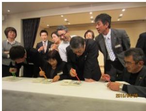
リレー形式で行われた 箸を使ってビー玉を移動させる競争 普段の箸使いが勝敗を分けた？