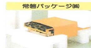
常盤パッケージ(株)