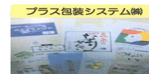
プラス包装システム(株)