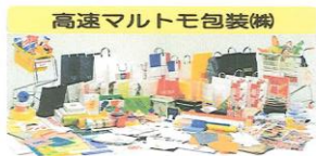
高速マルトモ包装(株)