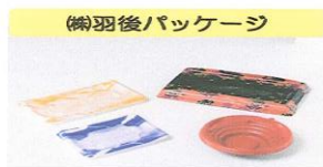
（株）羽後パッケージ