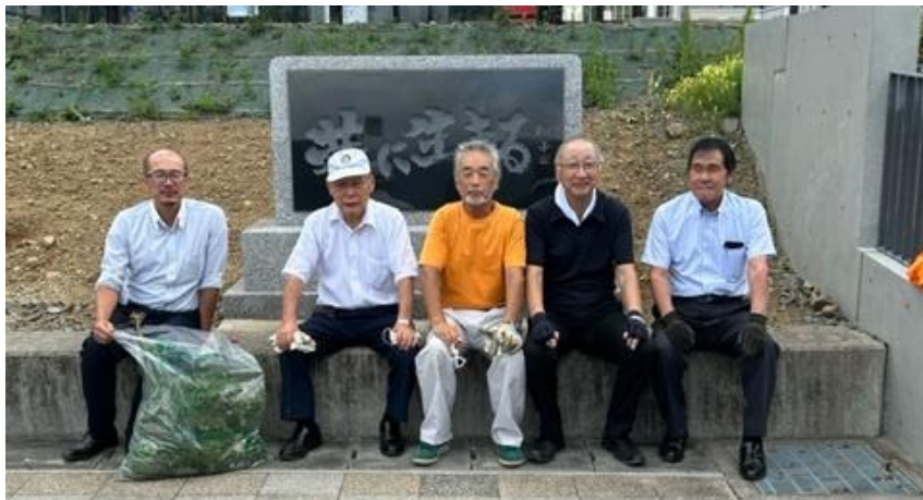
例会終了後 創立50周年記念碑前の清掃 (カメラマン：志田成樹会員)

気仙地区防犯協会連合会 事務局 〒022-0003 岩手県大船渡市盛町字下館下14番地2(大船渡警察署生活安全課内) TEL(FAX 兼)0192-27-3087/E-mail:bouhan_kesen@yahoo.co.jp