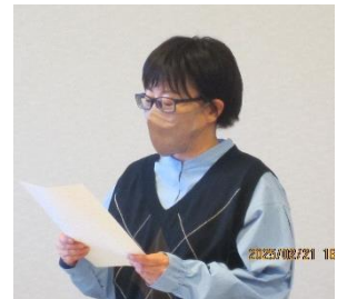
3年生に賞状（会長：アクター賞 会員：奨励賞）と記念品（名入多機能ボールペン）を授与